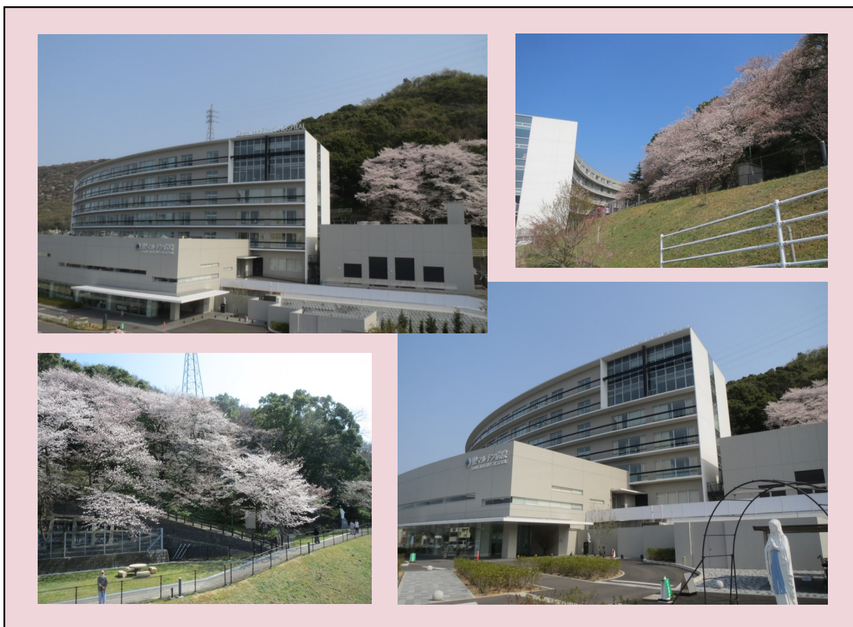
病院と笠山の桜 3月撮影

発行人:見市昇 発行所:聖マルチン病院 坂出市谷町1-4-13 (0877)46-5195 ホームページ http://sakaide-martinhp.jp/